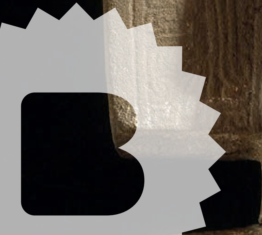
Figura de Vida y Muerte , 900–1250